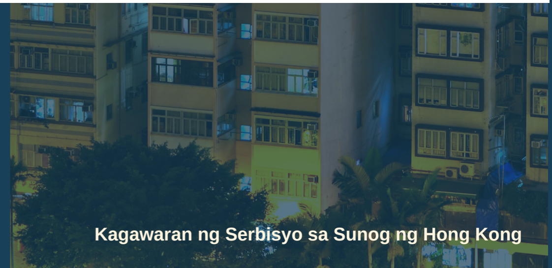
Kagawaran ng Serbisyo sa Sunog ng Hong Kong